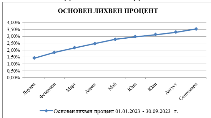
ОСНОВЕН ЛИХВЕН ПРОЦЕНТ НА БНБ ПРЕЗ ПЕРИОДА 01.01.2023 Г. ДО 30.09.2023 Г.

По данни на БНБ от 27 септември 2023 г. през август 2023 г. е 3.29%, като в сравнение с юли 2023 г. се увеличава с 0.17 процентни пункта.